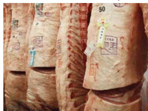
(手前) 金賞を受賞した「安福165の9」産子の枝肉

今回の共励会は、平成20年8月1日(金)に東京食肉市場で開催を予定しております。東京での開催は、ちょうど10回目を迎えることとなります。皆様からの出品をお待ちしております。